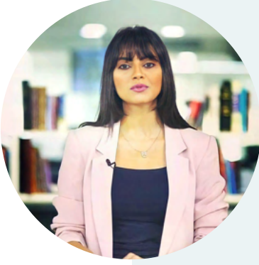
الإعلامية إيمان مبارك